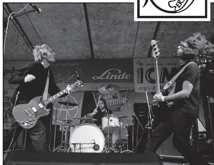
skupina The Pooh při „Červenání“ v roce 2010