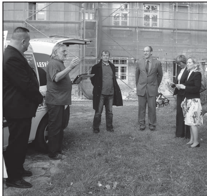
Fotografie z předávání sociálního automobilu, který v roce 2011 získalo jako sponzorský dar Středisko výchovné péče Spirála.